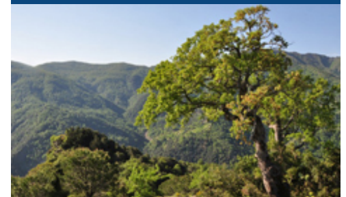
DI FRANCESCO BEVILACQUA